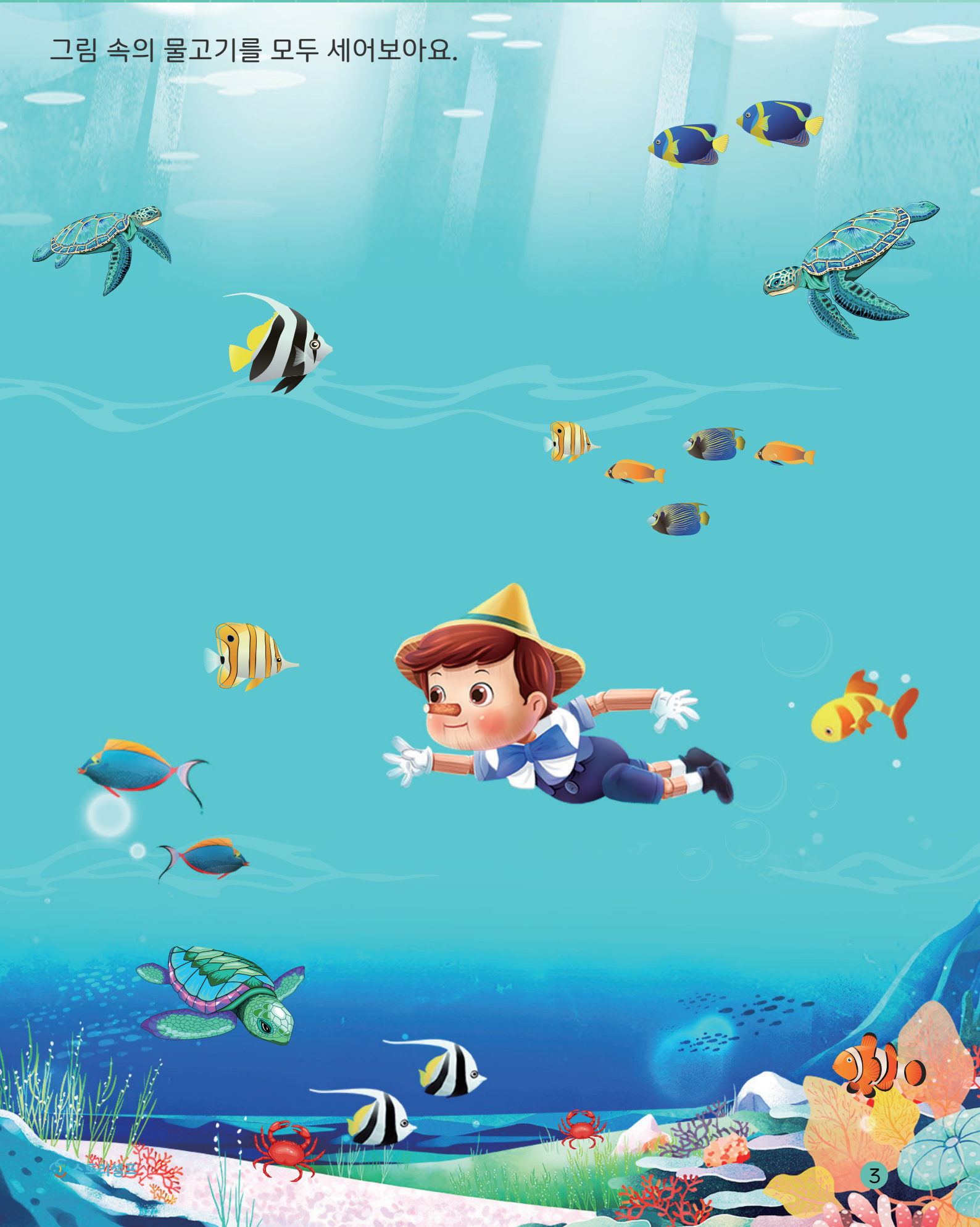
그림 속의 물고기를 모두 세어보아요.